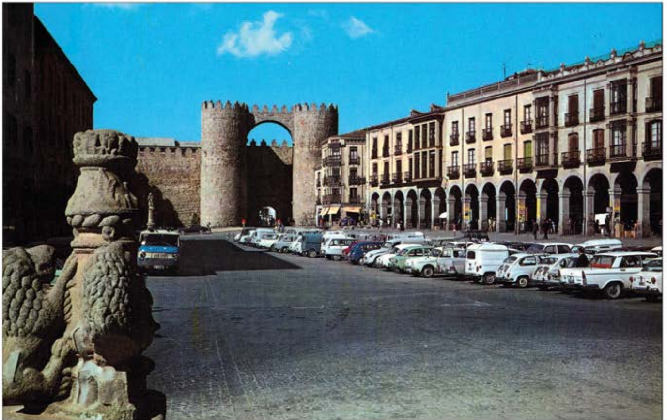
Plaza de Santa Teresa y Muralla, h. 1970. Artículo en el interior. Suplemento Especial Motor.