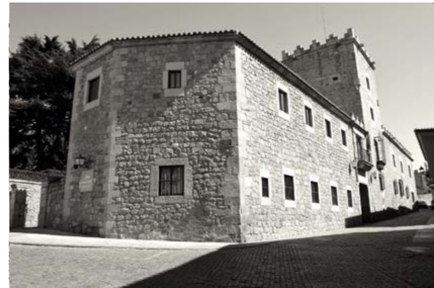
Palacio del Marqués de Canales de Chozas - Benavites - Piedras Alba. Actual parador de turismo.

A los que siguieron el marqués de Arenas, el de Silvela y de San Juan de Piedras Albas durante el primer tercio del siglo XX.