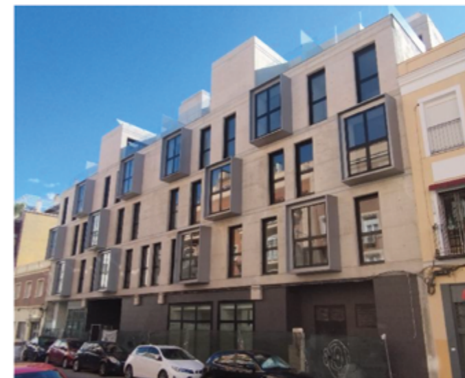
Construcción de Edificio de 28 viv. en Madrid