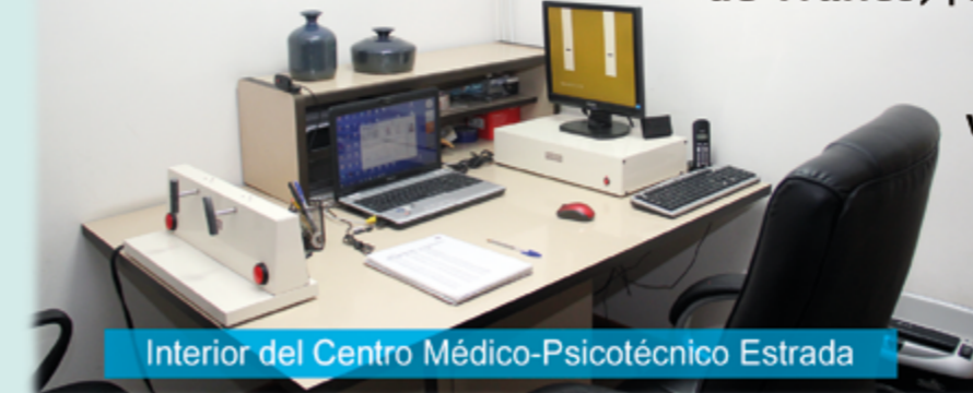
Interior del Centro Médico-Psicotécnico Estrada

Horario: De lunes a viernes: Mañanas 8,45 a 13,45 h Tardes 17 a 19 h