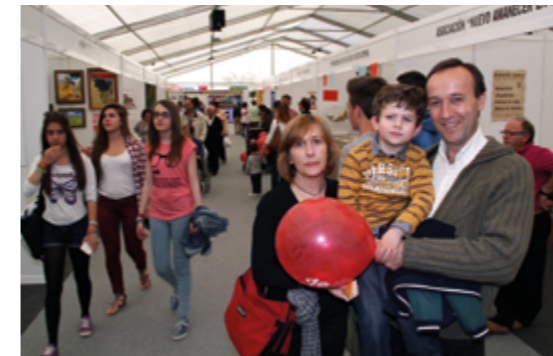
Feria de Muestras de Arévalo, año 2014

En los años sesenta, tras un letargo de muchas décadas, se produce un cambio rápido y radical en las estructuras agrarias y concretamente en la zona de Arévalo y La Moraña, de tal magnitud que cambió radicalmente el campo.