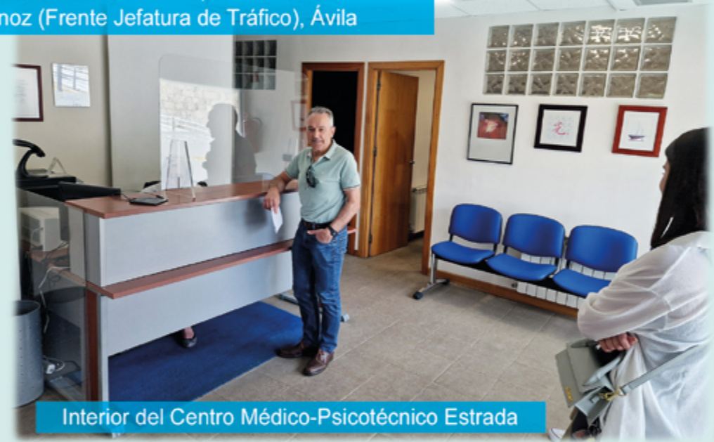
Interior del Centro Médico-Psicotécnico Estrada

Está autorizado y colabora de forma gratuita con la Jefatura Provincial de Tráfico de Ávila en la tramitación de las prórrogas de todos los Permisos de Conducción, realizando fotografías, cobro y gestión de las Tasas. Se entrega autorización, recibiendo el carnet renovado en su domicilio.