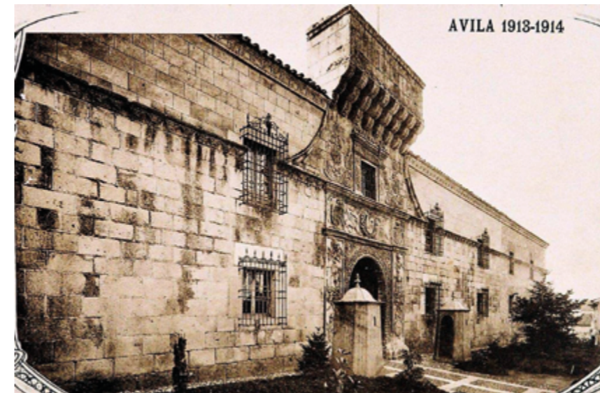
Palacio de Contreras o de Polentinos, luego Academia de Administración Militar, después Academia de Intendencia, y actualmente Archivo Militar y Museo de Intendencia, año 1913.

guías de Ávila de atañe sumamos el Museo de Ávila de la Casa de los Deanes, el renovado Museo Caprotti y el recientemente inaugurado Museo de Intendencia. El Museo de Intendencia que se halla instalado en el palacio de Polentinos, si bien, en un principio el conde de Polentinos tenía su palacio junto a la puerta del Carmen, pero al arruinarse éste se instaló en la Casa de los Contreras de la calle La Rúa al que dio su nombre. Este palacio, que también fue morada del marqués de Novaliches y sede del Ayuntamiento, se cedió al Ejército para academia militar en 1875, y desde 2011 alberga el Museo de Intendencia y es sede del Archivo General Militar. En él se exhibe cómo era la administración de los ejércitos a través de la Historia, se exponen diferentes tipos de carros, se muestran aspectos de equipo y la alimentación, se enseña como era la vida académica y la formación, y se exhiben retratos de intendentes, de sus héroes y sus caídos, así como prendas de uniforme y algunos objetos de la antigua Academia. Con ello, se nos traslada una visión militar del palacio propio de su antiguo uso militar, lo que propició que mantuviera una actividad casi permanente en sus instalaciones durante más de cien años. [...]