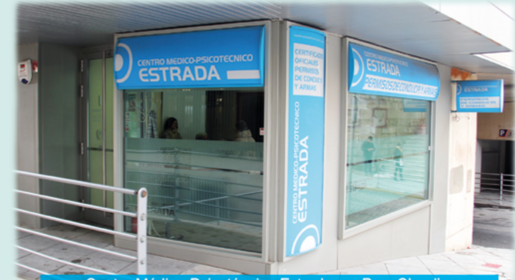
Centro Médico-Psicotécnico Estrada, en Pza. Claudio Sánchez Albornoz (Frente Jefatura de Tráfico), Ávila

Está autorizado y colabora de forma gratuita con la Jefatura Provincial de Tráfico de Ávila en la tramitación de las prórrogas de todos los Permisos de Conducción, realizando fotografías, cobro y gestión de las Tasas. Se entrega autorización, recibiendo el carnet renovado en su domicilio.