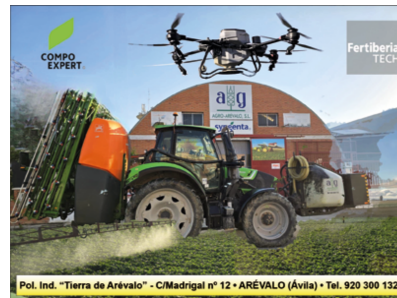
Pol. Ind. "Tierra de Arévalo" - C/Madrigal nº 12 • ARÉVALO (Ávila) • Tel. 920 300 132

Avda. Emilio Romero, 14 | Avda. Deportes, 3 Tels. 920 30 24 50 - 920 30 31 75 Mov. 670 72 56 50 - 607 562 063