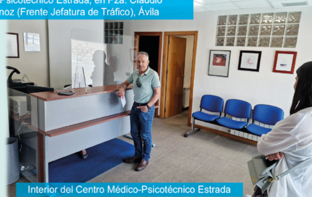
Interior del Centro Médico-Psicotécnico Estrada

Está autorizado y colabora de forma gratuita con la Jefatura Provincial de Tráfico de Ávila en la tramitación de las prórrogas de todos los Permisos de Conducción, realizando fotografías, cobro y gestión de las Tasas. Se entrega autorización, recibiendo el carnet renovado en su domicilio.