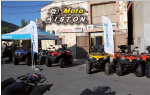
QUADS - MOTOS - BICICLETAS

Polig. La Peguera, 25-A • EL BARRACO (Ávila) Tels. 920 281 599 y 695 363 034