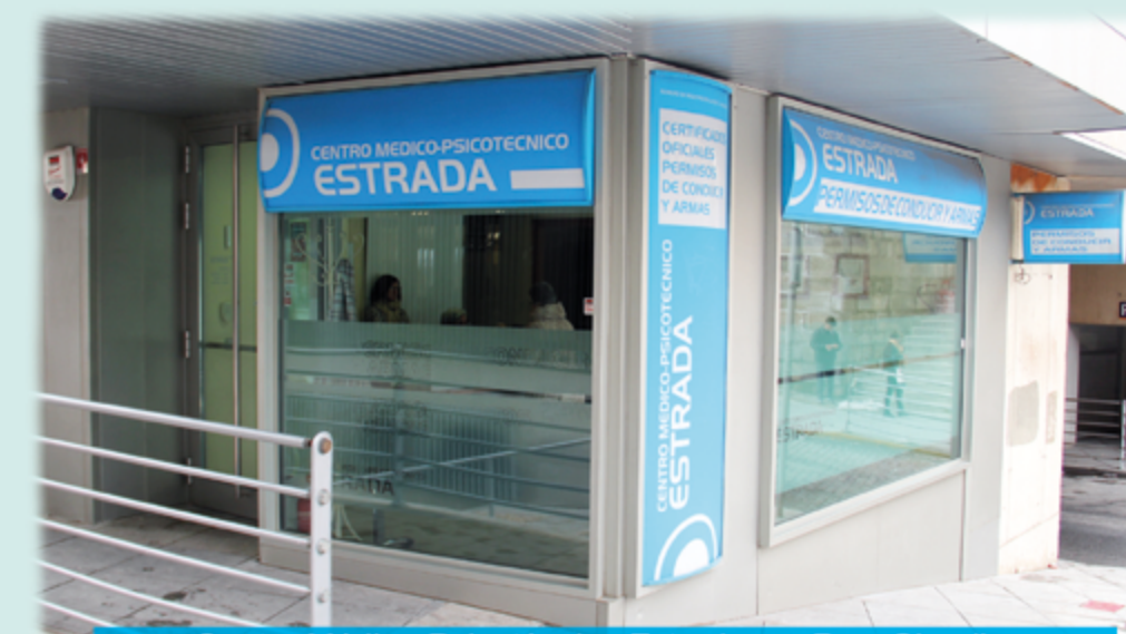
Centro Médico-Psicotécnico Estrada, en Pza. Claudio Sánchez Alborno (Frente Jefatura de Tráfico), Ávila

Está autorizado y colabora de forma gratuita con la Jefatura Provincial de Tráfico de Ávila en la tramitación de las prórrogas de todos los Permisos de Conducción, realizando fotografías, cobro y gestión de las Tasas. Se entrega autorización, recibiendo el carnet renovado en su domicilio.