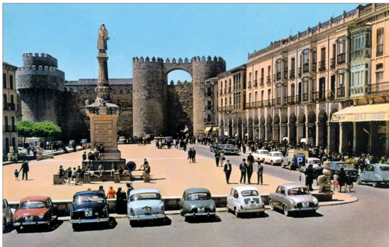
Plaza de Santa Teresa y Muralla de Ávila, h. 1960.

Artículo en el interior.