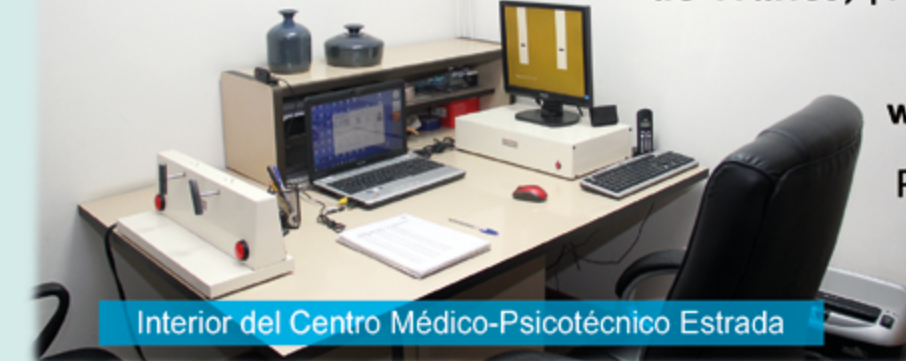
Interior del Centro Médico-Psicotécnico Estrada

Horario: De lunes a viernes: Mañanas 8,45 a 13,45 h Tardes 17 a 19 h