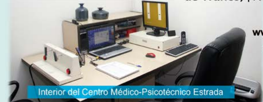
Interior del Centro Médico-Psicotécnico Estrada

Horario: De lunes a viernes: Mañanas 8,45 a 13,45 h Tardes 17 a 19 h