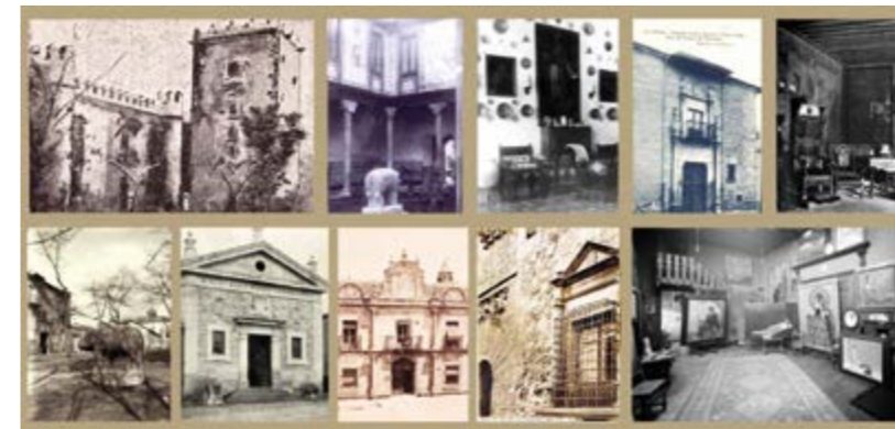
Palacios y casas museo de Ávila.

aristocracia, eran los que solían formar colecciones de interés, ya que se lo permitía su posición económica y social. De ahí que sus nombres y genealogías se repitan como una constante cuando hablamos de palacios abulenses, a los que despojamos de la aureola de antaño para hacernos imaginariamente con sus colecciones o las de sus señores con el fin de convertirlas en patrimonio cultural de todos.