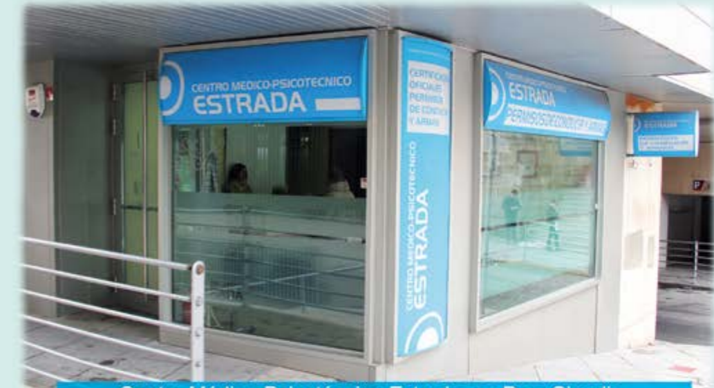
Centro Médico-Psicotécnico Estrada, en Pza. Claudio Sánchez Albornoz (Frente Jefatura de Tráfico), Ávila

Está autorizado y colabora de forma gratuita con la Jefatura Provincial de Tráfico de Ávila en la tramitación de los prórrogas de todos los Permisos de Conducción, realizando fotografías, cobro y gestión de las Tasas. Se entrega autorización, recibiendo el carnet renovado en su domicilio.