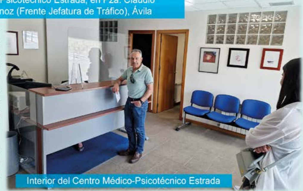
Interior del Centro Médico-Psicotécnico Estrada

Está autorizado y colabora de forma gratuita con la Jefatura Provincial de Tráfico de Ávila en la tramitación de los prórrogas de todos los Permisos de Conducción, realizando fotografías, cobro y gestión de las Tasas. Se entrega autorización, recibiendo el carnet renovado en su domicilio.