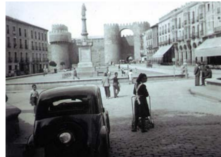
Plaza del Mercado Grande. Año 1945.

de colecciones como síntoma de decadencia; de la impresionante colección pictórica de Goya, Madrazo y Sorolla que aglutina a numerosos personajes de la historia abulense, con quienes existen lazos familiares y/o de vecindad o paisaje que tanto unen, y de las colecciones que guardan en otros palacios fuera de Ávila; y de las colecciones que no tienen palacio, y de los palacios que no tienen colecciones.