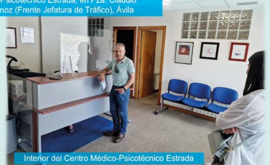
Interior del Centro Médico-Psicotécnico Estrada

Está autorizado y colabora de forma gratuita con la Jefatura Provincial de Tráfico de Ávila en la tramitación de las prórrogas de todos los Permisos de Conducción, realizando fotografías, cobro y gestión de las Tasas. Se entrega autorización, recibiendo el carnet renovado en su domicilio.