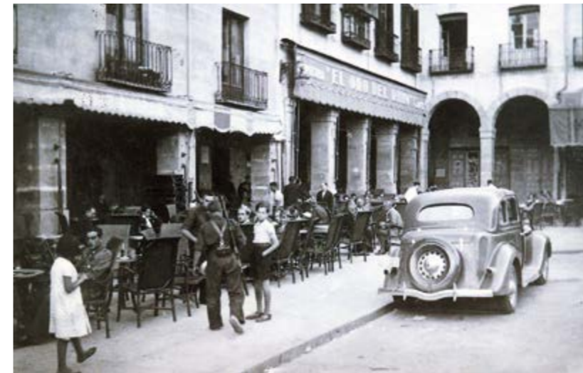
Plaza del Mercado Grande. Terrazas de cafés, 1936.