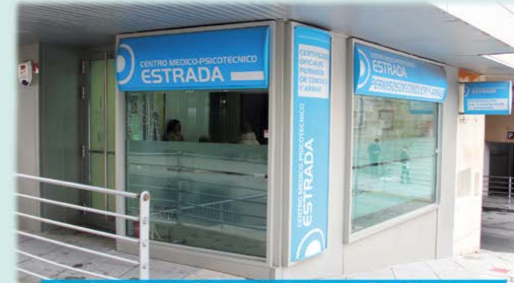
Centro Médico-Psicotécnico Estrada, en Pza. Claudio Sánchez Albornoz (Frente Jefatura de Tráfico), Ávila

Está autorizado y colabora de forma gratuita con la Jefatura Provincial de Tráfico de Ávila en la tramitación de las prórrogas de todos los Permisos de Conducción, realizando fotografías, cobro y gestión de las Tasas. Se entrega autorización, recibiendo el carnet renovado en su domicilio.