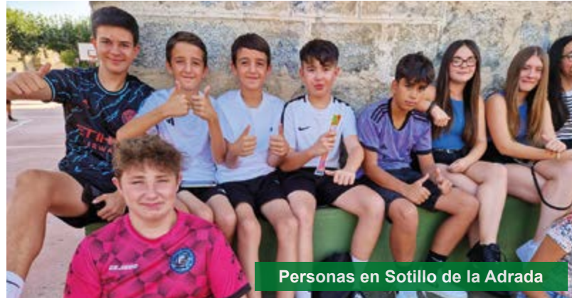
Personas en Sotillo de la Adrada