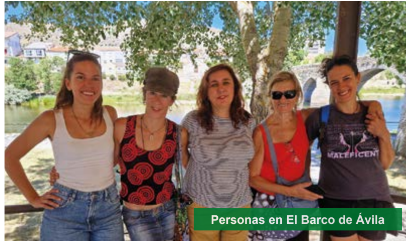
Personas en El Barco de Ávila