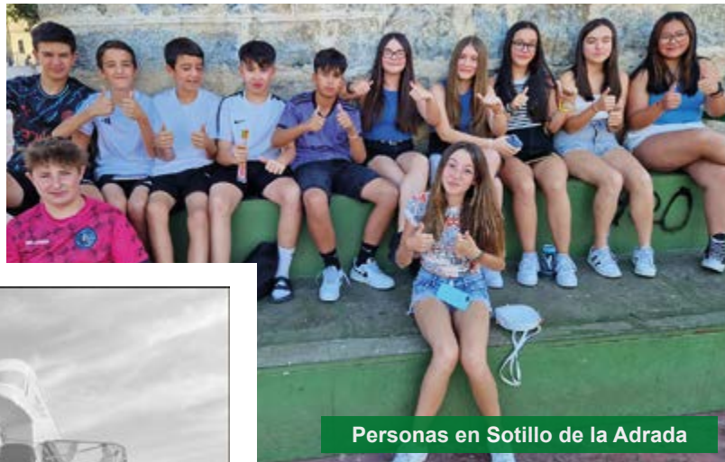
Personas en Sotillo de la Adrada

Sotillo de la Adrada goza de un microclima que proporciona una estancia muy agradable, ya que las temperaturas no son extremas y no se producen precipitaciones excesivas. Además, podemos disfrutar de unos parajes maravillosos con ríos y gargantas que bañan sus montañas y arbolados valles.