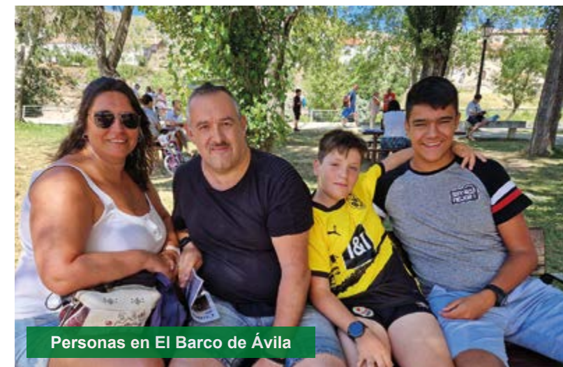
Personas en El Barco de Ávila

El Barco de Ávila está bañada por las frescas y cristalinas aguas del río Tormes con unos paisajes espectaculares.