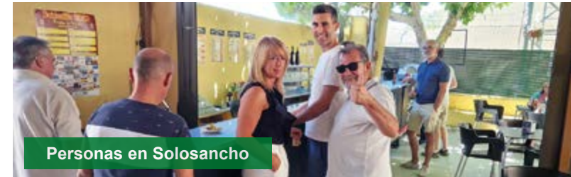
Personas en Solosancho