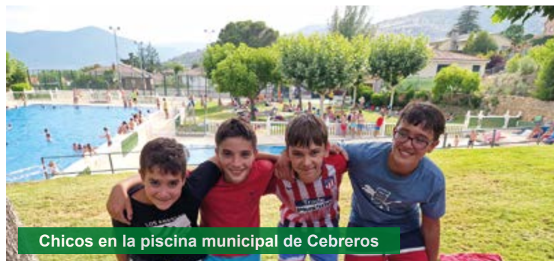
Chicos en la piscina municipal de Cebreros