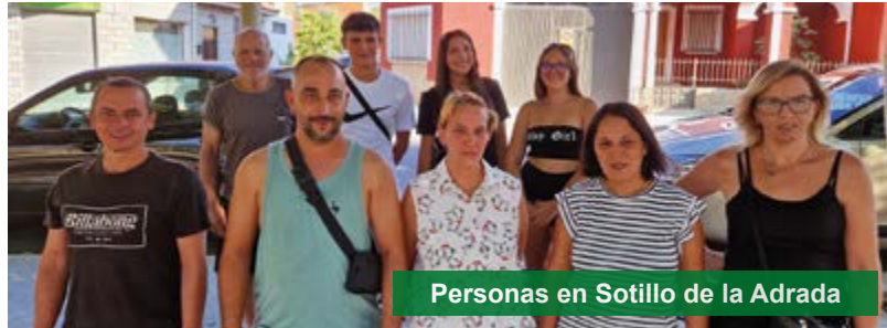
Personas en Sotillo de la Adrada