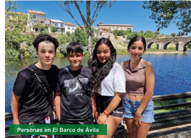
Personas en El Barco de Ávila