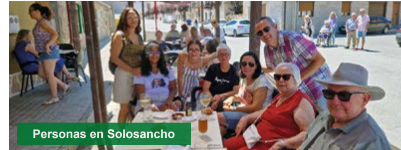
Personas en Solosancho

La fiestas de verano en Solosancho se celebran el último fin de semana de agosto.