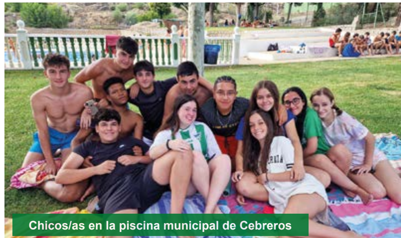
Chicos/as en la piscina municipal de Cebreros