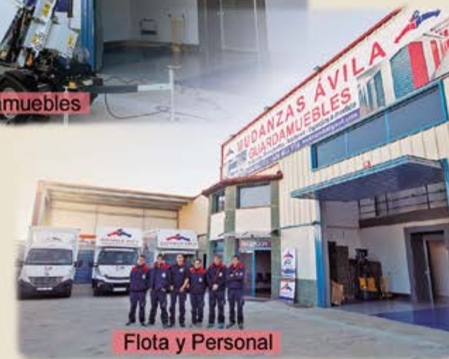
Flota y Personal