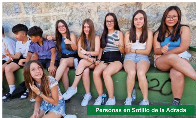
Personas en Sotillo de la Adrada

Las fiestas de Sotillo de la Adrada, en honor a la Virgen de los Remedios, se celebran entre finales de agosto y el 9 de septiembre, siendo el 8 el día grande.