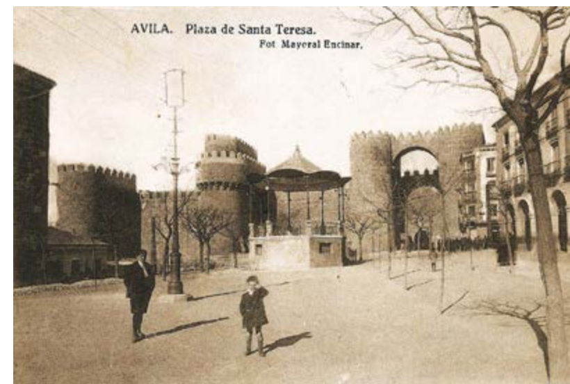
Foto: Plaza del Mercado Grande. Templete de música. Tarjeta postal Mayoral Encinar, 1927.

Las actuaciones de la Banda Municipal tenían especial protagonismo durante las celebraciones festivas, y así se anunciaban, por ejemplo, en las ferias de septiembre de 1931: “Día 5: De nueve a once de la noche Concierto por la Banda Municipal en el Mercado Grande e inauguración de una tómbola benéfica, pro obreros, para la que donarán preciosas muñecas confeccionadas por distinguidas señoritas. Día 9: Fuegos artificiales de gran vistosidad, colocándolos a ser posible en el torreón del Alcázar, y en los intermedios Concierto”.