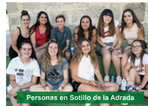
Personas en Sotillo de la Adrada