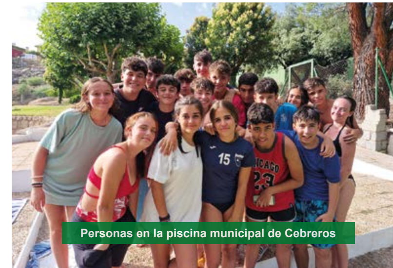
Personas en la piscina municipal de Cebreros