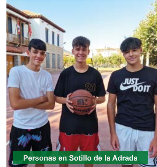
Personas en Sotillo de la Adrada