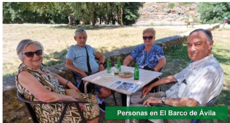
Personas en El Barco de Ávila