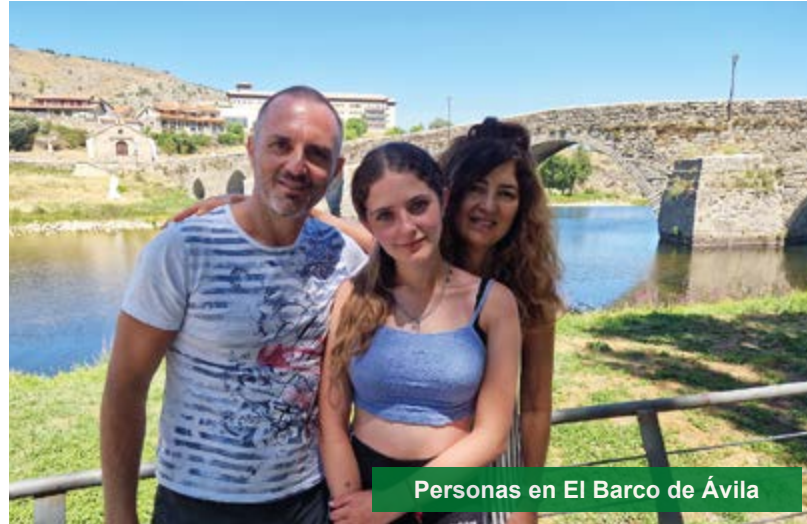
Personas en El Barco de Ávila