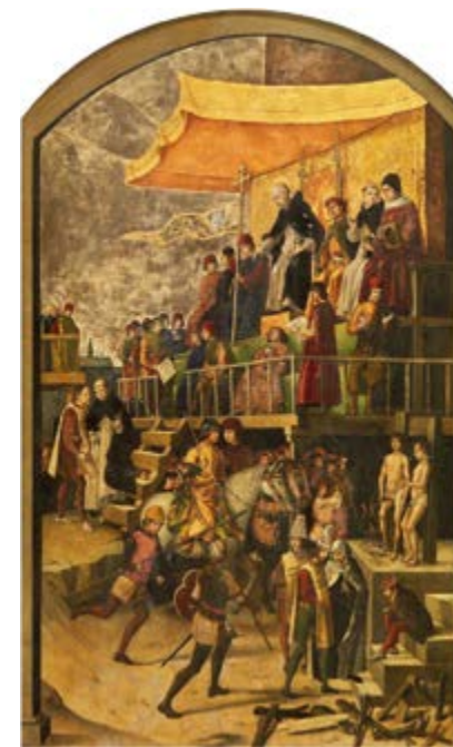
Foto: "Auto de Fe" en la Plaza del Mercado Grande, Pedro Berruete, h. 1493

Fe celebrados en Valladolid en 1559 y en Toledo en 1605, por ejemplo.