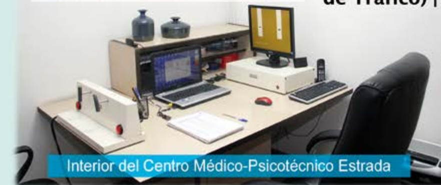
Interior del Centro Médico-Psicotécnico Estrada

Horario: De lunes a viernes: Mañanas 8,45 a 13,45 h Tardes 17 a 19 h