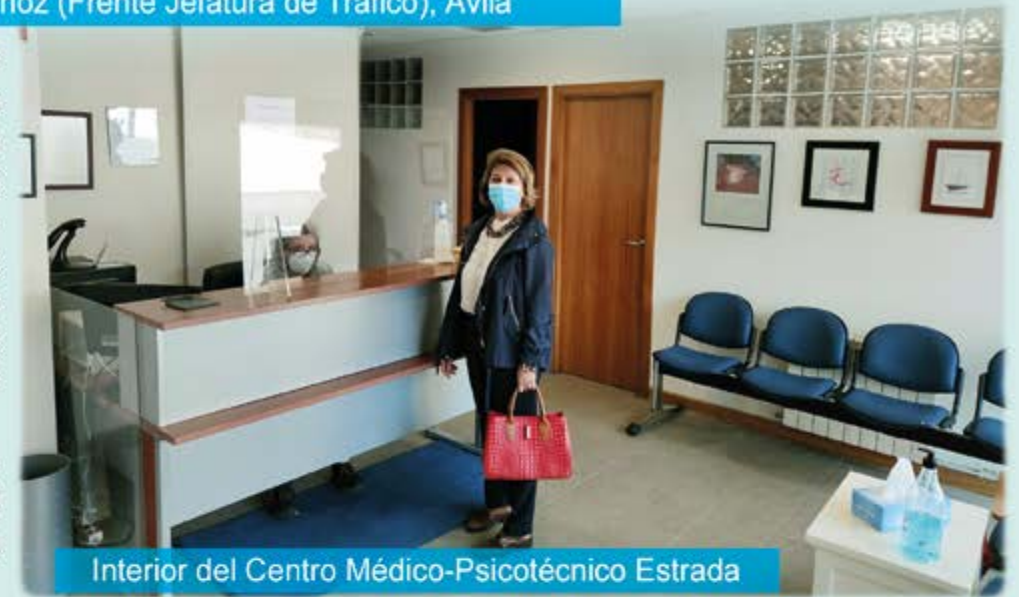
Interior del Centro Médico-Psicotécnico Estrada

Está autorizado y colabora de forma gratuita con la Jefatura Provincial de Tráfico de Ávila en la tramitación de las prórrogas de todos los Permisos de Conducción, realizando fotografías, cobro y gestión de las Tasas. Se entrega autorización, recibiendo el carnet renovado en su domicilio.