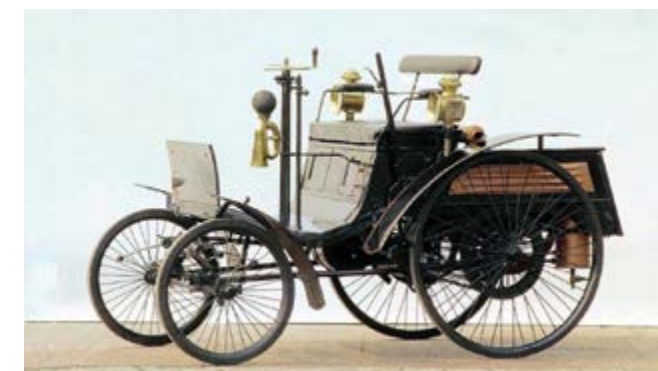
Benz Velo, el primer coche de producción en masa de la historia.

Previamente existían carretas tiradas por animales