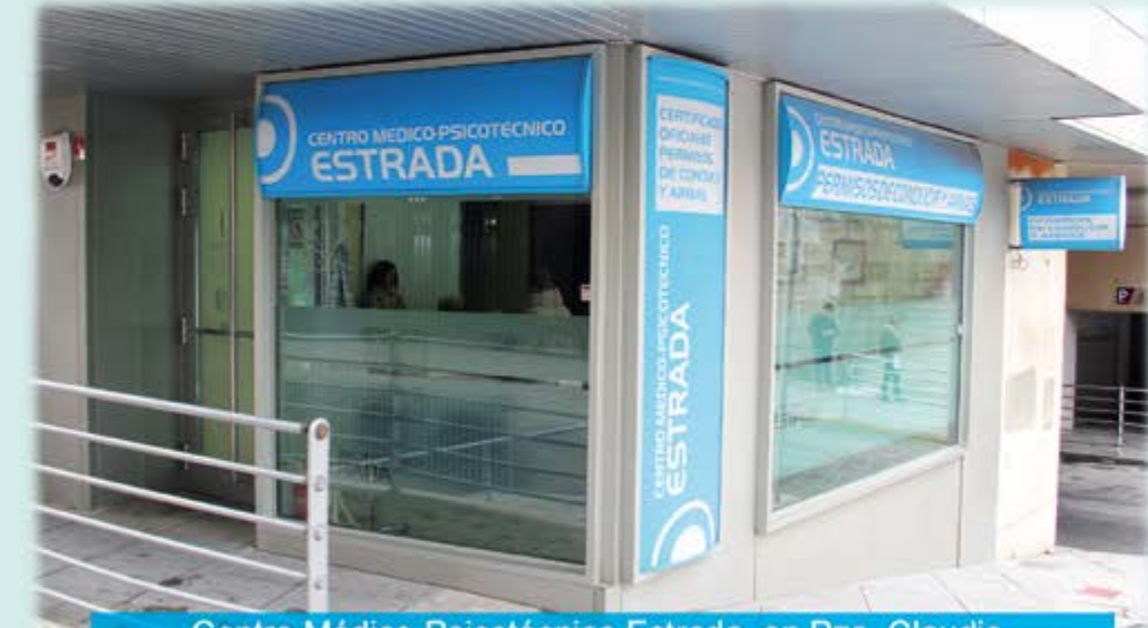
Centro Médico-Psicotécnico Estrada, en Pza. Claudio Sánchez Albornoz (Frente Jefatura de Tráfico), Ávila

Está autorizado y colabora de forma gratuita con la Jefatura Provincial de Tráfico de Ávila en la tramitación de las prórrogas de todos los Permisos de Conducción, realizando fotografías, cobro y gestión de las Tasas. Se entrega autorización, recibiendo el carnet renovado en su domicilio.